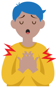
Dolor de pecho