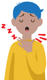
Problemas para dormir