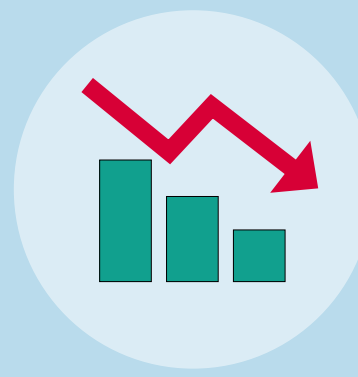
Costos más bajos