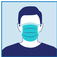
Khẩu Trang Dùng Một Lần